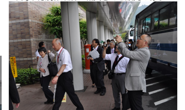
↑ 正面玄関に飾りつけてある注連縄を撮影する皆さん