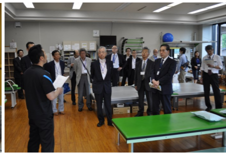
リハビリテーション科視察