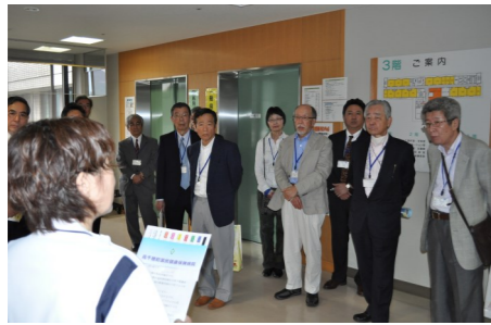
病棟視察(写真は一般病棟)