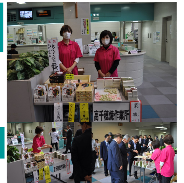
↑ 高千穂焼作業所の職員さんと販売の様子