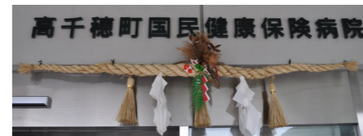
↑ 当院正面玄関の注連縄

注連縄には神様が宿るとされ、1年間の無病息災を祈願する縁起の良いものですから、来院された皆様にもきっと神話の町高千穂の神様のご加護があることと思います!