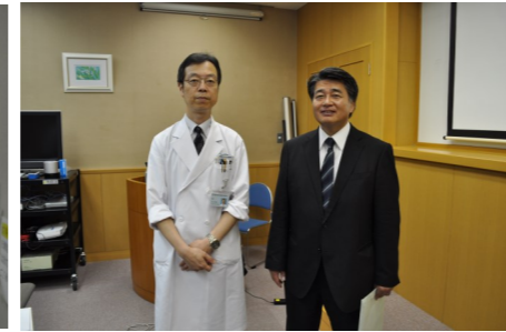
久米院長(左)と箕田前院長(右)