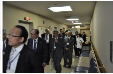
ラウンド形式で院内を視察